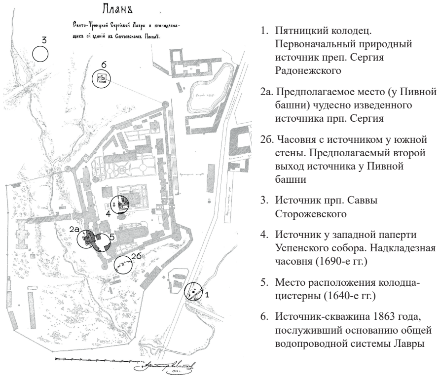
Илл. 2. План Свято-Троицкой Сергиевой Лавры и принадлежащих ей зданий в Сергеевском Посаде, 1902 г. Архитектор А. А. Латков

«сам вышел из монастыря, взяв с собою одного брата, и спустился в овраг [дѣбрь, низину], находящийся под монастырем, в котором никогда не текла вода, как достоверно сообщили нам старые люди. Найдя в каком-то рву немного воды, собравшейся после дождя, и преклонив колени, святой начал молиться» 10 .