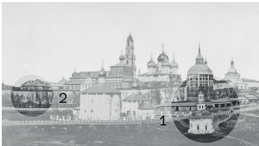
Илл. 3. Вид Троице-Сергиевой Лавры с Блинной горы. Фотография 1870-х гг.

Таким образом, источник изначально находился на некотором удалении и не исчезал; в противном случае братья вряд ли роптала бы на неудачно выбранное место. Скорее всего, монахи пожаловались бы игумену на полное исчезновение источника. И тогда прп. Сергей, видя общую беду, сам бы попытался исправить положение. Например, монахи призвали бы мастеров колодезного дела и искали бы место, подходящее для установки колодезного сруба, вблизи монашеских келий.