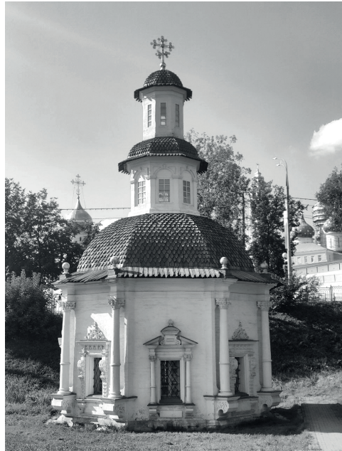
Илл. 1. «Колодец Преподобного Сергия Радонежского с Пятницкой часовней», XIV, конец XVII века.

Место, выбранное прп. Сергием для пустынножителства, у монахов троицкого иноческого братства вызывало порою неудовольствие и ропот. Некоторые из братии даже укоряли своего игумена в неудачном выборе места, и делали это не раз. Ропщущие указывали, в частности, на удалённость источника питьевой воды от братских келий. Преподобный, как уже было замечено, помогал братии, носил в водоносах с подножья холма воду. В смиренном ответе недовольной братии Преподобный игумен лишь указывает на своё изначальное желание подвизаться на этом месте уединённо, но так как «Бог пожелал воздвигнуть такую обитель для прославления Своего святого имени», братьям следует дерзать в молитве и не изнемогать. Уповая на молитвы братии, прп. Сергей