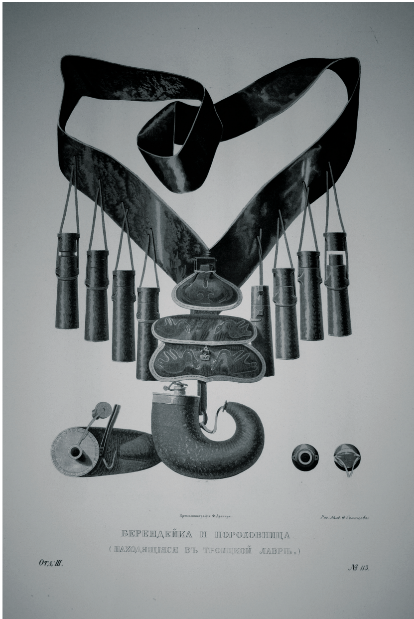
Рис. 2. Берендейка из СТСЛ (пороховница). Источник: Солнцев Ф. Г. Древности Российского государства, изданные по высочайшему повелению. Отделение III (броня, оружие, кареты и конская сбруя). М. 1853. Табл. 113. Фото: Т. Ю. Токарева (Сергиево-Посадский музей-заповедник).