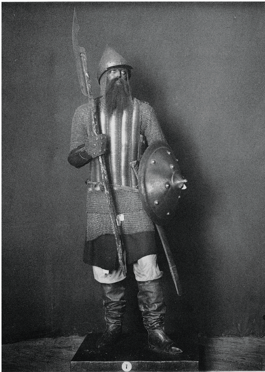
Рис. 4.