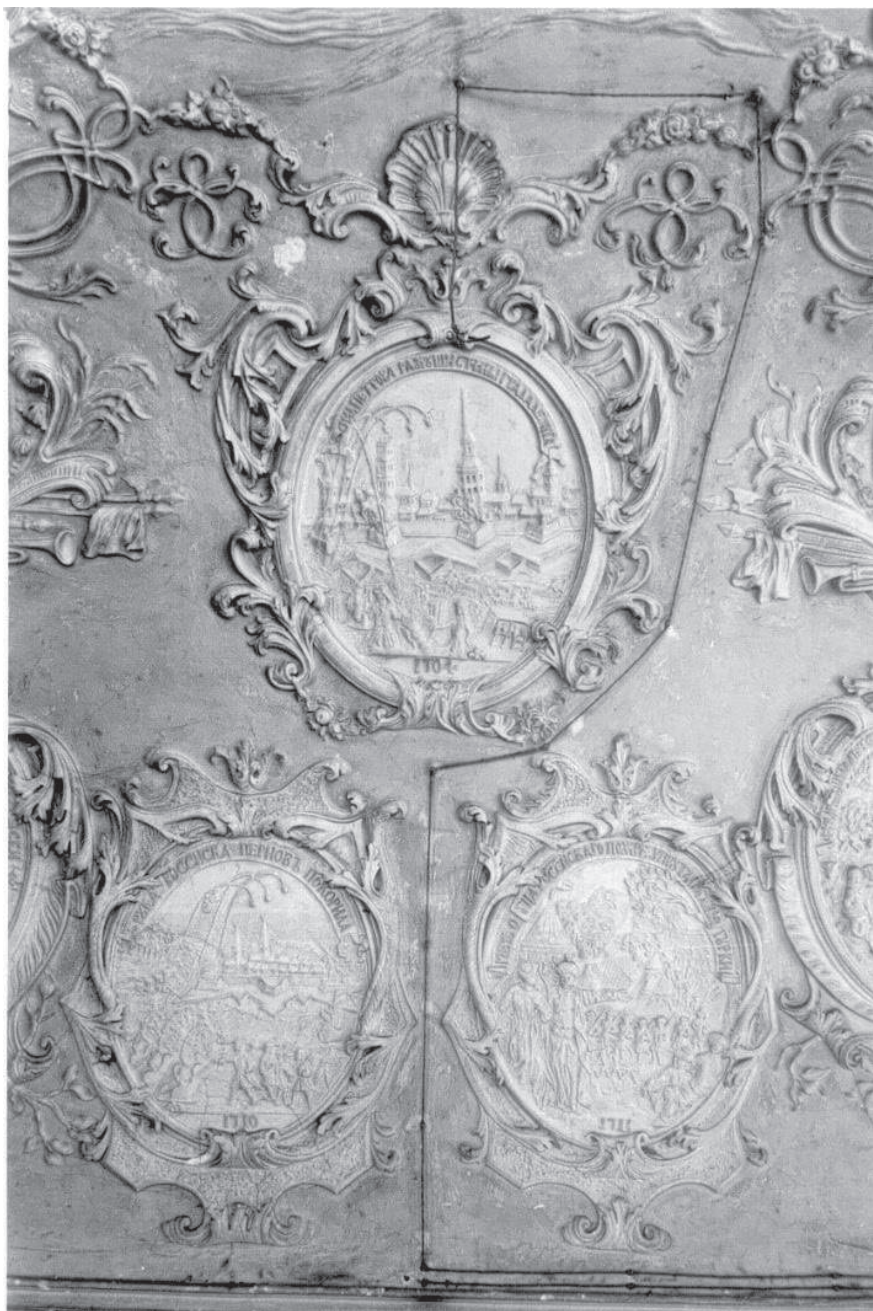
Царские чертоги. Общежитие студентов. 1938 г. Фото