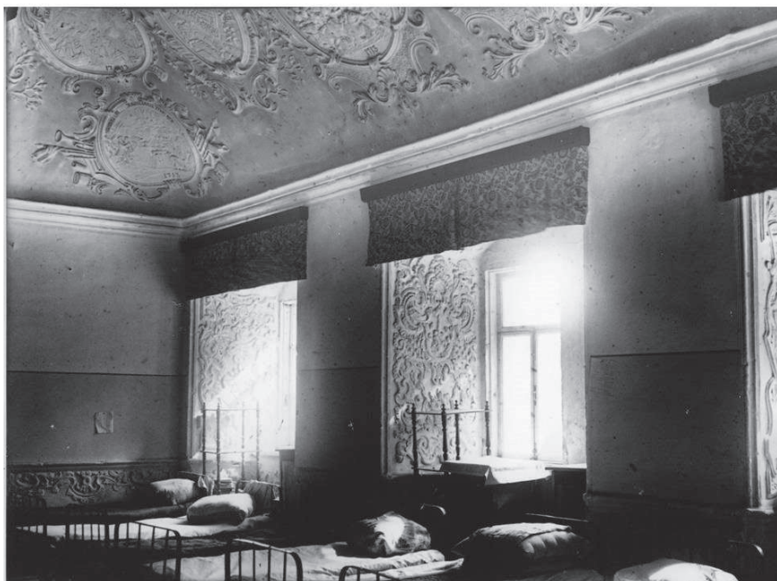
Царские чертоги. Общежитие студентов. 1938 г. Фото