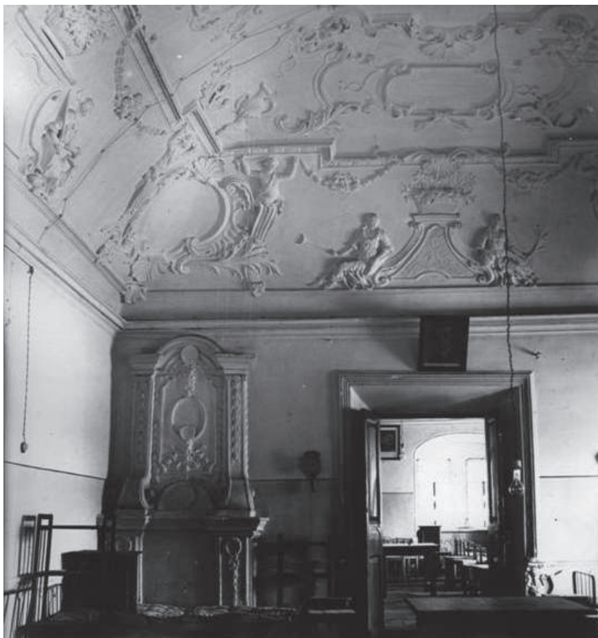
Царские чертоги. Общежитие студентов. 1938 г. Фото

помещения, а Чертоги приспособить так, чтобы использование их Педтехникумом содействовало полной неприкосновенности художественного оформления этих Чертогов» 43 .