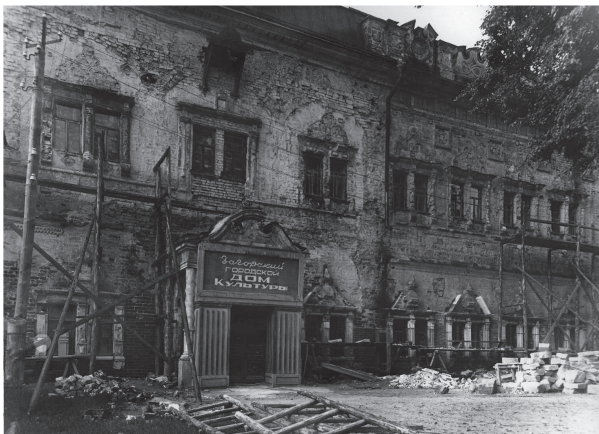
Царские чертоги. Загорский городской дом культуры. Середина 1940-х годов. Фото

У музея и института были взаимные претензии друг к другу. Институт, принявший помещение «по акту непосредственно от Всесоюзной академии художеств, а не от музея» затратил средства «на первоочередной восстановительный ремонт», а музей, по его мнению, «ничем не проявил себя в смысле помощи по восстановлению, охране» 54 . Музей же, рассчитывая разместить в Чертогах экспозиции, ратовал за выселение Пединститута, возмущаясь тем, что «несмотря на невероятную грязь, антисанитарию и разрушения, произведенные общежитием в здании Чертогов, Горсовет продолжает отстаивать право Учительского института на использование ценного архитектурно