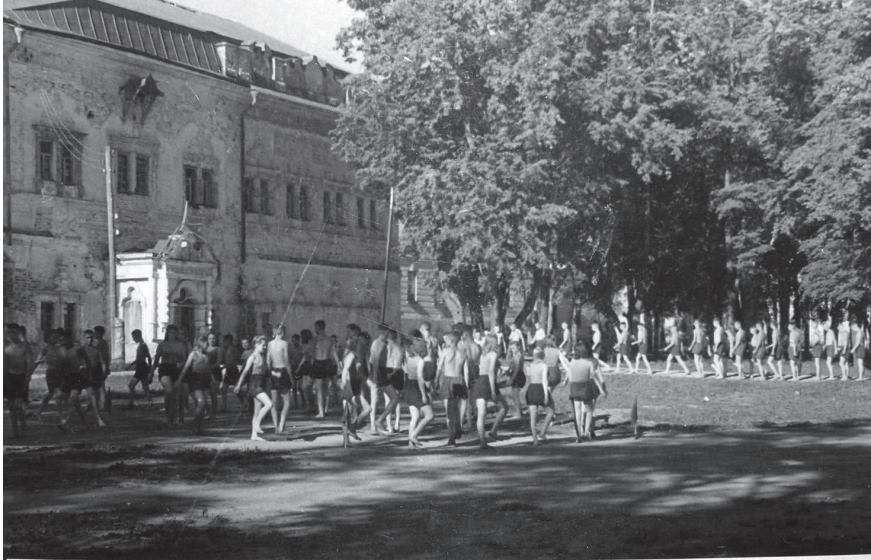
Учащиеся художественно-ремесленного училища. 1948 г. Фото

Театр, являвшийся единственным культурно-зрелищным учреждением в городе занимал площадь 1 000 кв. м, зрительный зал вмещал 700 чел. В 1946 г. данное помещение было заново переоборудовано силами 23-х организаций города: расширена сцена, оборудовано фойе и проведены другие работы 66 . Театр просуществовал Чертогах до открытия в городе Дворца культуры им. Ю. А. Гарина — в 1954 г. После выезда театра помещение храма было передано Академии. Его освящение состоялось 21 мая 1955 г. 67 Таким образом, здание Чертогов в полном объеме стало принадлежать МДА.