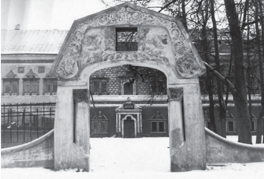
Царские чертоги. Южный фасад. Западная часть занята МДА, восточная – Загорским Домом культуры. Вторая половина 1940-х годов. Фото

в нем имуществом книгами и рукописями принял зав. отделением библиотеки Государственного Румянцевского Музея К. Попов 72 .