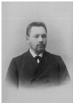
Рис. 3. Профессор Иван Михайлович Покровский. 1890-е гг.

от биографических очерков отдельных исторических персоналий до анализа культурных, социально-экономических и религиозных аспектов жизни.