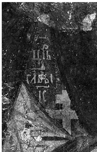
Илл.9. Надпись на схиме преподобного Сергия.

Присутствие в составе записи пигмента берлинской лазури позволяет заключить, что они были сделаны не ранее середины XVIII в., что подтверждает сведения о поновлении образа.