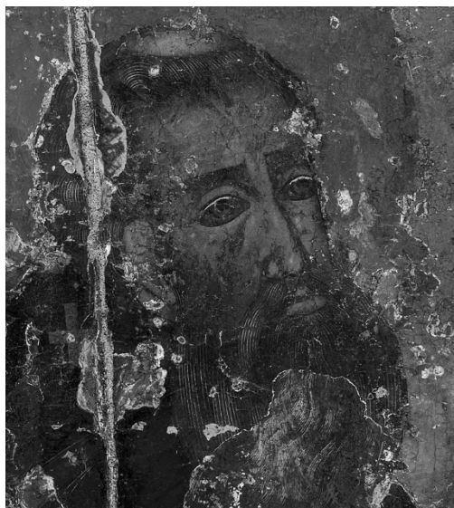
Илл.8. В процессе реставрации. Лик преподобного Никона.

Такие приемы письма, как простота и тщательность исполнения, несколько упрощенный рисунок, характерные, по мнению исследователей, для произведений троицких мастеров, 13,14 свойственны и этому образу.