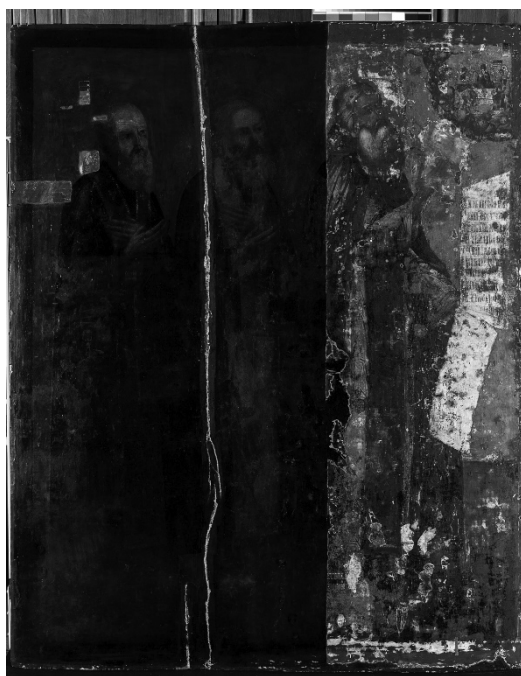
Илл.3. «Преподобные Сергей, Никон, Савва». После удаления слоев масляной записи и грунта с правой трети иконы.

После проведения консервационных работ были выполнены пробы на удаления покрытия и записи. В ходе работы установлено, что под масляной записью по всей поверхности иконы находится сплошной слой твердого и плотного масляного грунта красного цвета. Под грунтом лежит изображение, выполненное темперными красками.