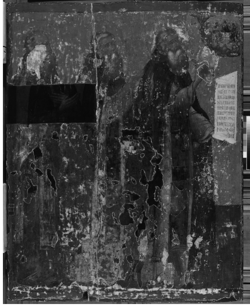
Илл.4. «Преподобные Сергей, Никон и Савва». В процессе удаления слоев масляной записи и грунта.

Большую площадь на поверхности иконы занимают различные по размеру разновременные вставки: вставки восковой мастики с масляной живописью, вставки левкаса с записью, особенно крупные – в левой части иконы. Вероятно, эти крупные вставки левкаса сделаны одновременно с записью в XVIII в.