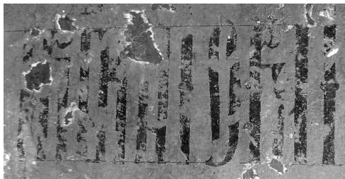
Илл.6. Надпись на фоне.

На фоне между центральной фигурой преподобного и фигурой преподобного Сергия открылась надпись вязью, выполненная черным колером, «ПРЕПОДОБНЫЙ СЕРГИЙ» (илл.6).