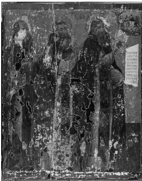
Илл.5. «Преподобные Сергей, Никон, Савва», вторая половина XVII в. После удаления темперной записи со всей поверхности иконы (запись на вставках сохранена).

Доска была опилена по левому краю. Левое поле отсутствует, и фигура преподобного Саввы упирается в край иконы. По полям, контурам фигур и нимбов найдены заполненные грунтом гвоздевые отверстия, в некоторых местах - мелкие латунные гвоздики, небольшой фрагмент латунной басмы.