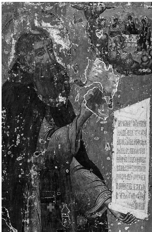
Илл.7. В процессе реставрации. Преподобный Сергий.

Наиболее сохранным выглядит изображение преподобного Сергия.