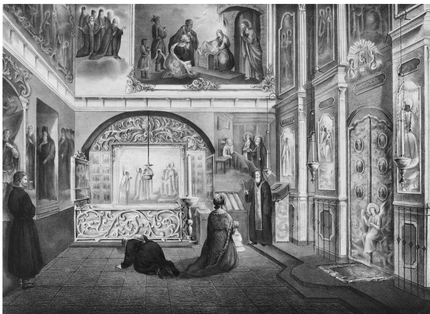
Ил. 2. Неизвестный художник. Вид церкви Пр. Никона и рака Пр. Никона. Литография. 1864 г.

В архивном деле дано его полное описание, и оно точно соответствует иконостасу, изображенному на литографии 1864 г. и на старых фотографиях (ил. 2, 3). Единственное изменение в нем при постановке