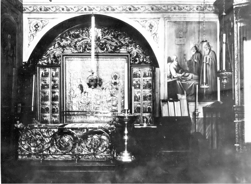
Ил. 4. Рака Пр. Никона. Фотография. Конец XIX – начало XX вв.

Из первого дошедшего до нас описания храма известно, что над ракой прп. Никона был установлен образ Пресвятой Богородицы на престоле с предстоящими митрополитами московскими Петром и Алексеем и преподобными Сергием и Никоном Радонежским 53 .