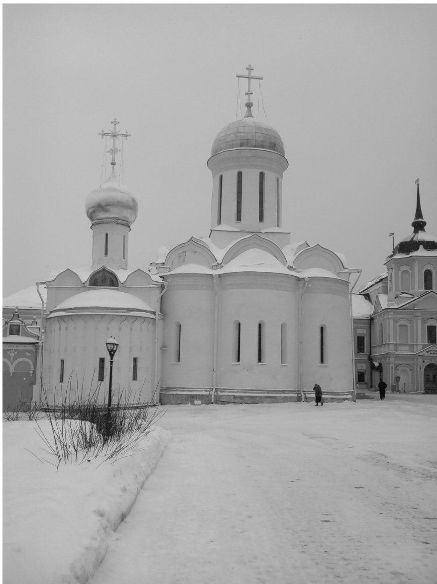
Ил. 1. Троицкий собор и Никоновская церковь. Фото 2021 г.