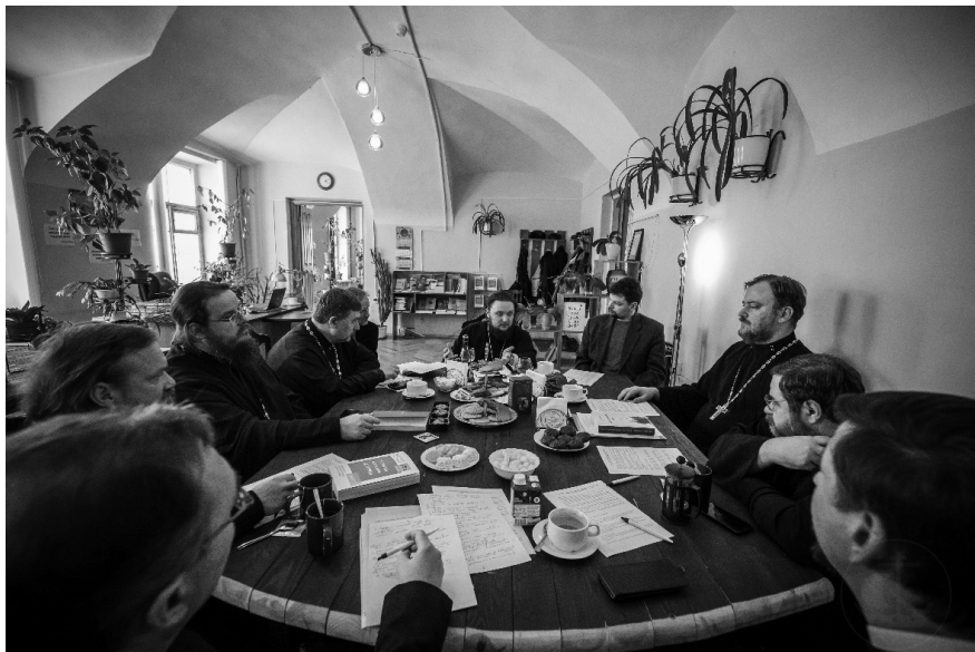
Собрание по учреждению общества 22.02.2019

для систематического изучения науки церковного (канонического) права. Несмотря на то, что до революции и после возрождения в 1946 г. в Академии существовали кафедры церковного законовещения и канонического права, однако именно специализированного научного сообщества ранее никогда не было.